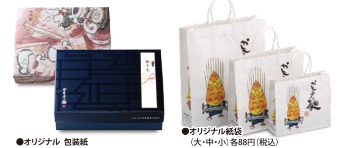
●オリジナル 包装紙

※現在使用しております紙袋の在庫がなくなり次第、 リニューアルした紙袋へ変更させていただきますのでご了承ください。