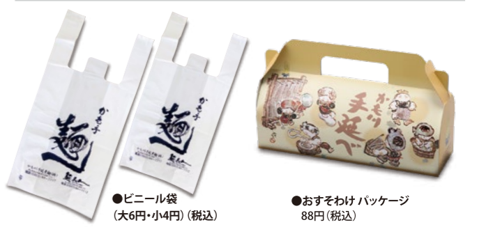
●ビニール袋 (大6円・小4円) (税込)